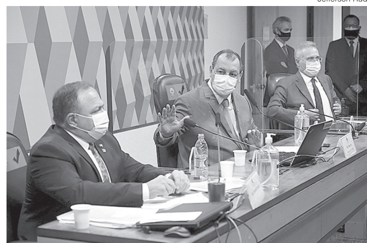
Após passar mal na quarta-feira, depoimento de Pazuello foi retomado nesta quinta-feira

Randolfe defendeu que a CPI reserve duas semanas para ouvir representantes de laboratórios que produzem vacinas contra o coronavírus. E que reserve outra semana para ouvir cientistas e especialistas. Ele