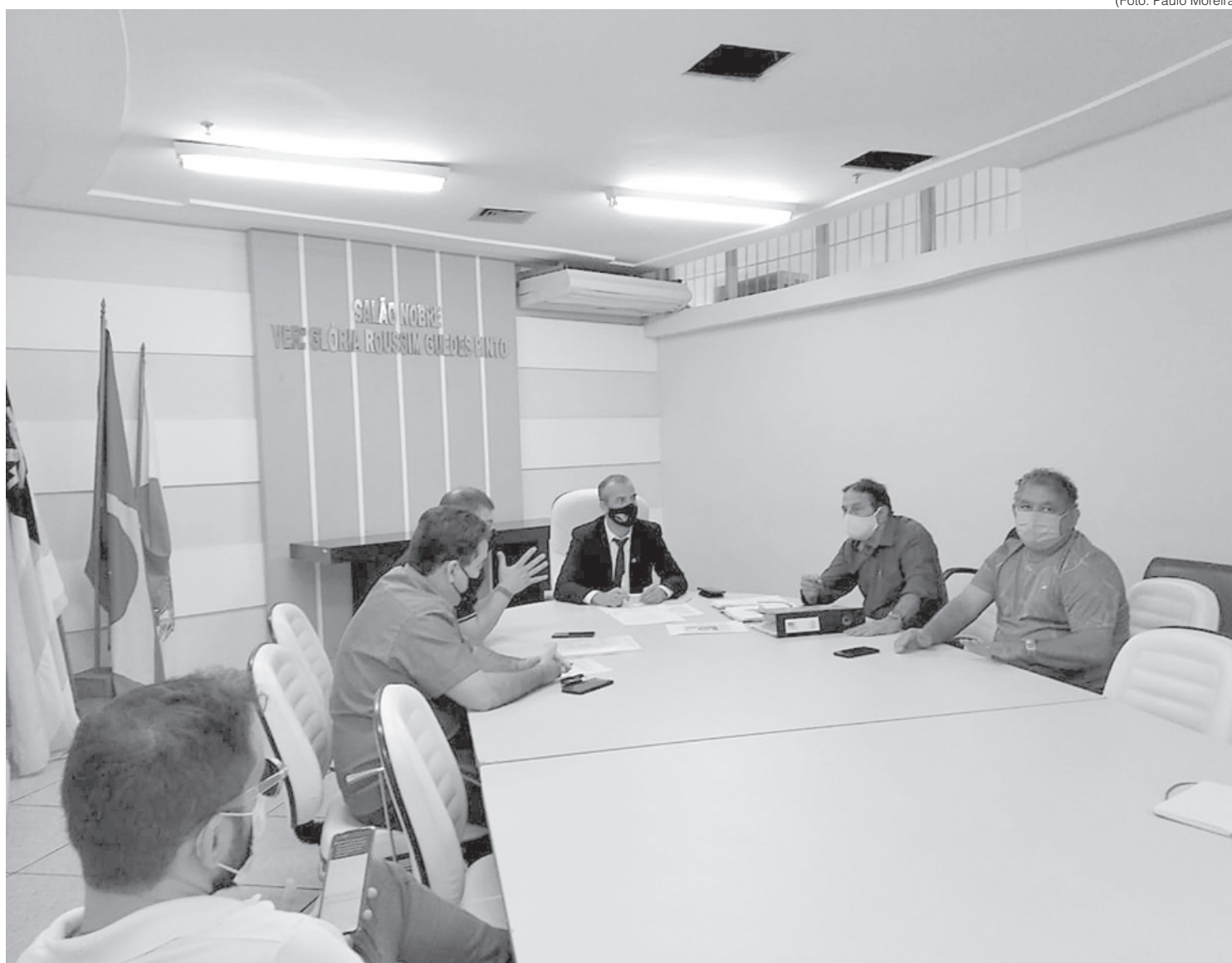
Vereadores discutem a criação de um novo Plano Diretor