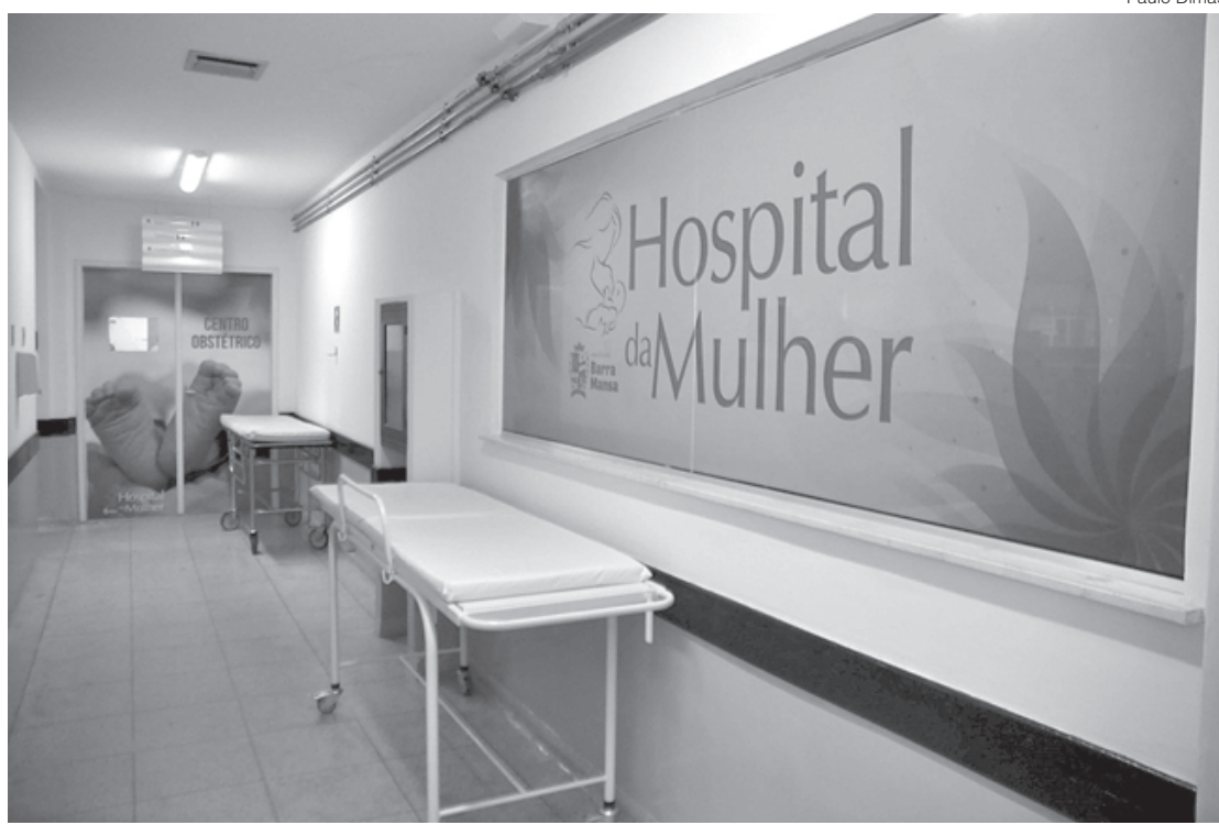
Vagas são destinadas para o Hospital da Mulher, policlínicas, manutenção, Vigilância em Saúde, Vigilância Sanitária, entre outros

Órgão Público - Documento expedido pelo Poder Federal, Estadual ou Municipal, conforme o âmbito da prestação da atividade, em papel timbrado, com identificação do órgão expedidor, data e assinado pelo Departamento de Pessoal/ Recursos Humanos ou equivalente, especificando cargo e função e período de atuação (infor-