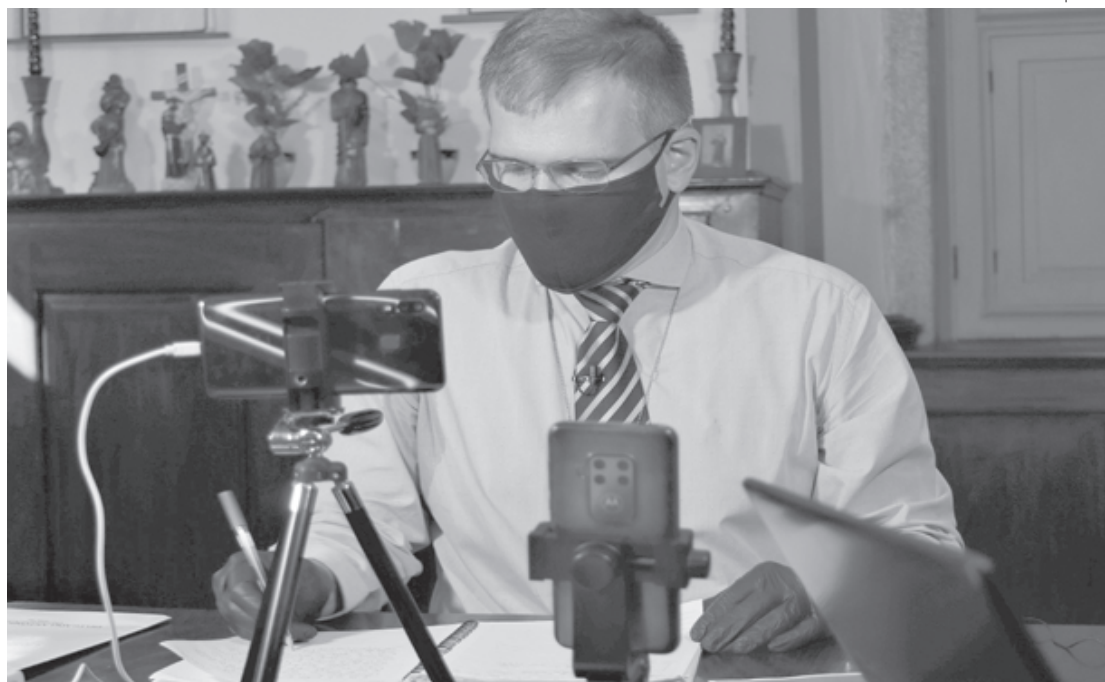
Furtado conversa com superintendente dos correio sobre problemas no atendimento

– Sabemos que a falta de efetivo é um problema