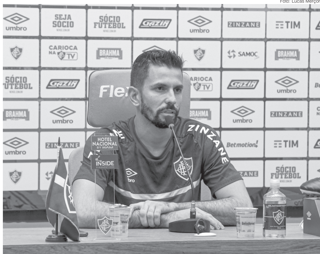
Goleiro concedeu entrevista coletiva nesta quinta-feira, dia 20, no CT Carlos Castilho antes do Fla-Flu

Uma vitória sobre o River Plate garante não só a vaga como a classificação com o primeiro lugar do grupo ao Fluminense. A si-