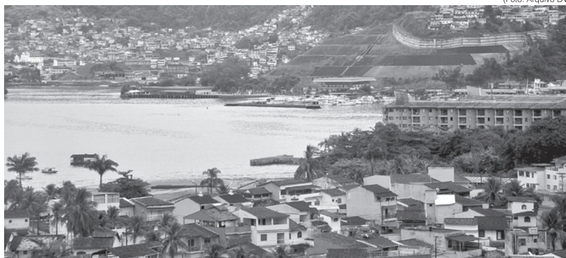
Frequência a praias de Angra dos Reis volta a ser permitida, com limitações

As residências desta modalidade terão que passar por higienização diária com troca de roupa de cama e de banho. A realização de festas, eventos ou churrascos nestas propriedades permanecem proibidas.