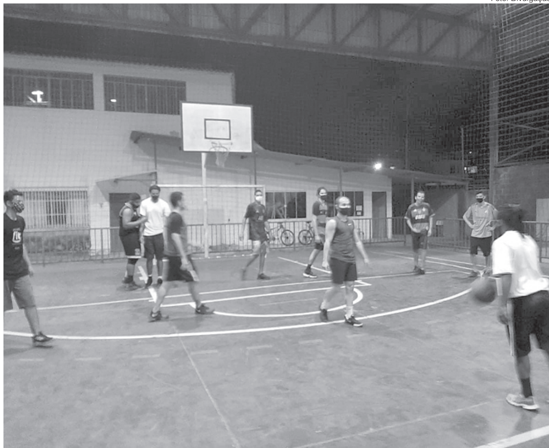
As inscrições para o projeto estão abertas para jovens maiores de 15 anos

As inscrições devem ser feitas na Subsecretaria de Juventude, Esporte e Lazer (SMJEL), localizada na Rua Luis Ponce, 263, no Centro, ou no local das atividades com os professores responsáveis. Mais informações pelo telefone 2106-3491.