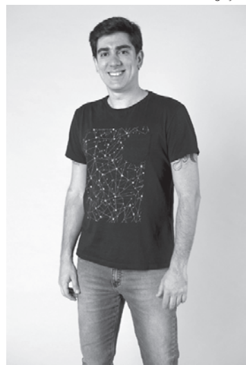
Marcelo Adnet estava reservado para 'Novo Normal'

Todos bem ajustados para a época em que foram levados ao ar. Hoje, lamentavelmente, não está mais sendo possível. Culpar o politicamente correto pode ser uma justificativa, mas nada deve ser comparado, por exemplo, ao período da ditadura. Ou da censura. Concorda?